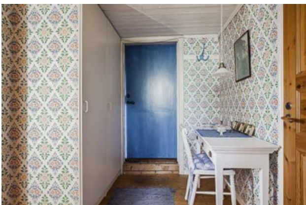
Eingang in den Flur in der Gästewohnung