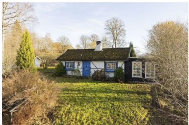
Blick zum Haus