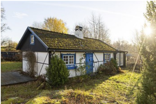
Blick auf das Haus

Besonderheiten: • Glasfaseranschluss für Internet und TV liegt an der Grundstücksgrenze • das Inventar ist im Kaufpreis enthalten • Die Feuerstätten wurden zuletzt 2021 gekehrt. Eine neue Abnahme inkl. Brandschutzkontrolle ist notwendig.