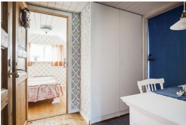
kleiner Flur in der Gästewohnung