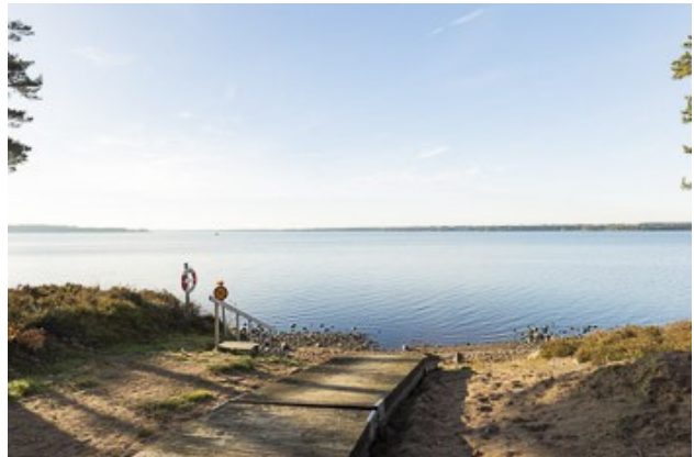
Badeplatz am Vikensee