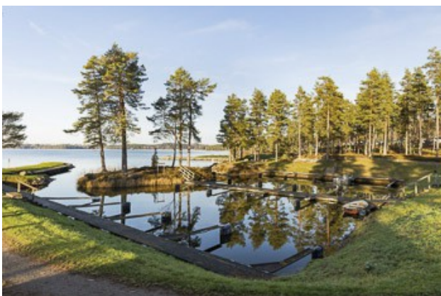
Bootsanleger am Vikensee