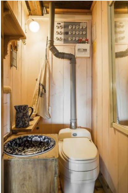
Badezimmer mit Trockentoilette