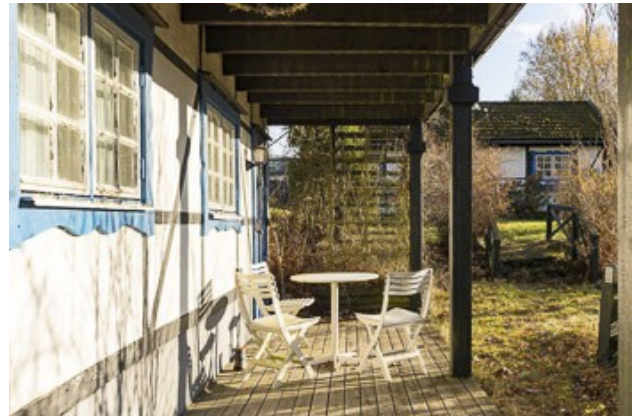
Garage mit kleiner Gästewohnung