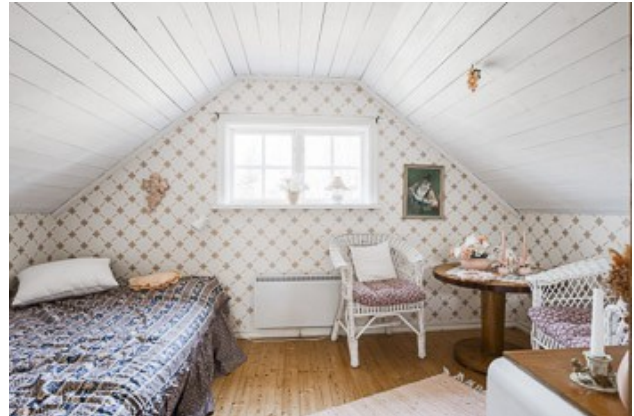
1. Schlafzimmer in der Gästewohnung