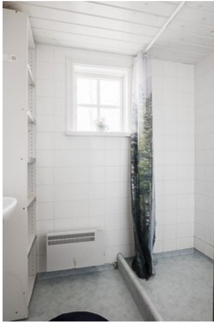
Badezimmer Flur in der Gästewohnung