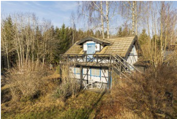
Garage mit kleiner Gästewohnung