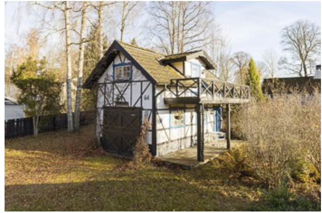
Garage mit kleiner Gästewohnung