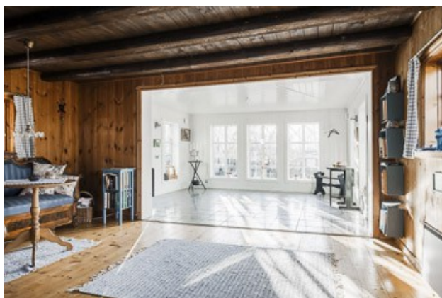
Blick in das große Wohnzimmer