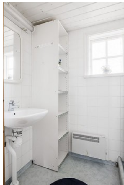
Badezimmer Flur in der Gästewohnung