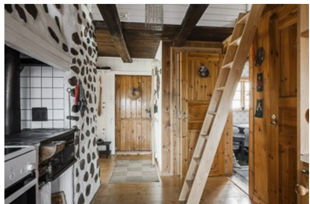
Leiter hoch zur Schlafloft