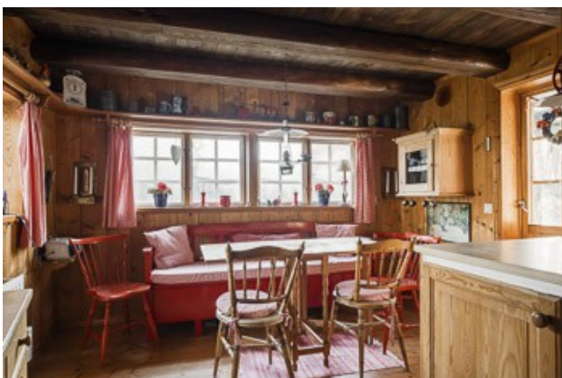
Essecke bei der Küche