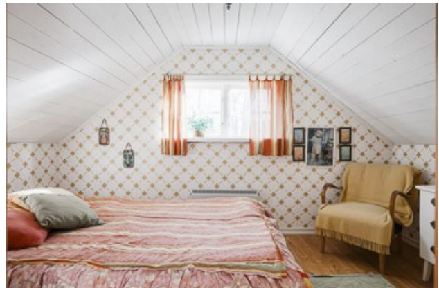
2. Schlafzimmer in der Gästewohnung