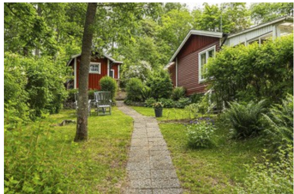
Blick über das Grundstück