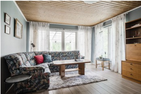
Blick in das Wohnzimmer