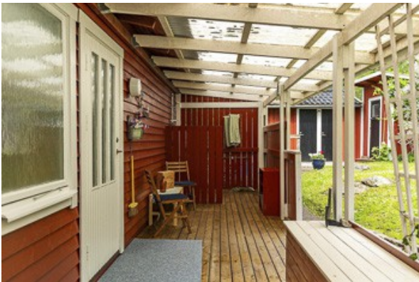
auf der hinteren Veranda