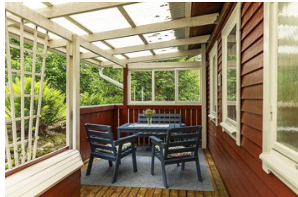
auf der hinteren Veranda