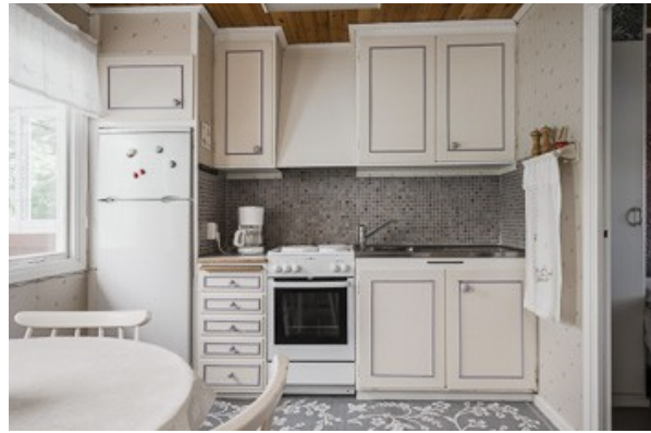
in der Küche