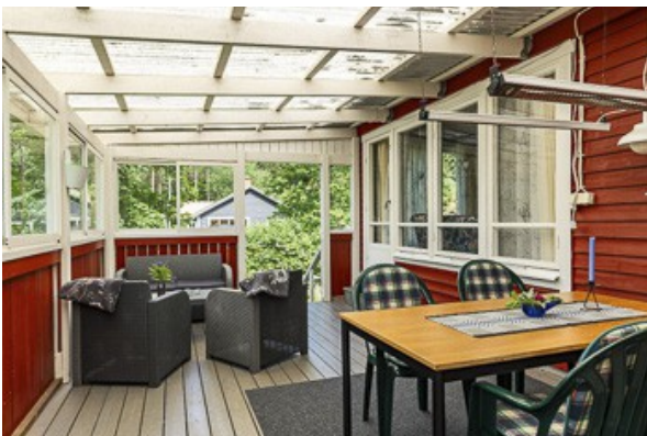
auf der vorderen Veranda