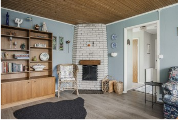
Kamin im Wohnzimmer