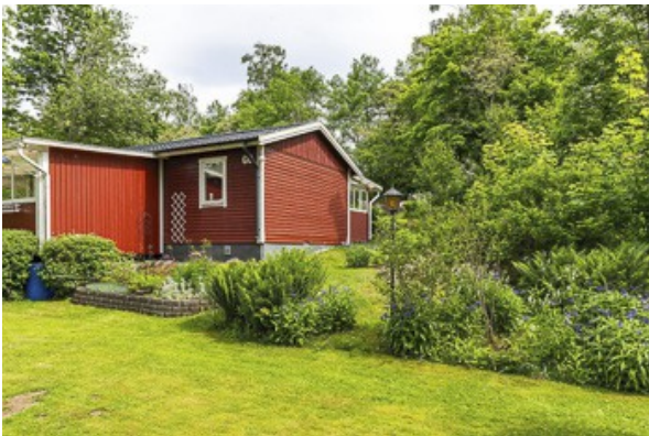
Blick über das Grundstück