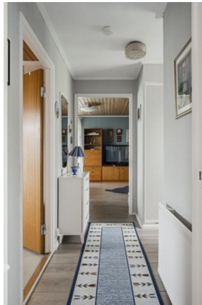
in der Küche