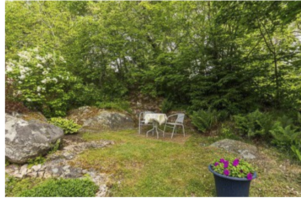
Blick über das Grundstück