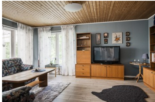
Blick in das Wohnzimmer