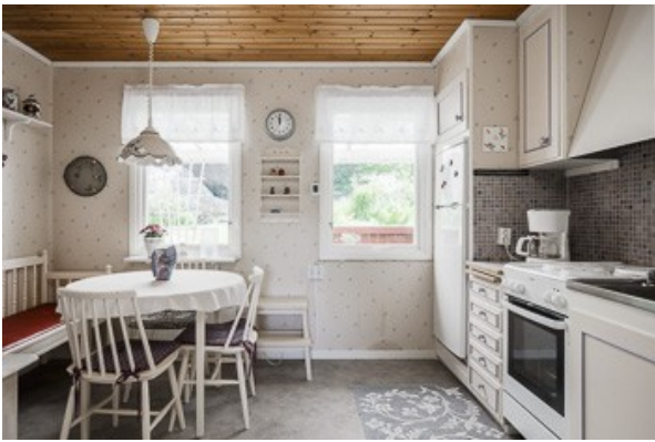
in der Küche