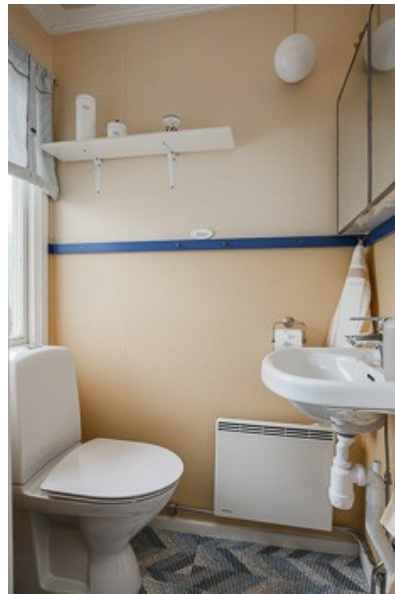
Blick in das Badezimmer