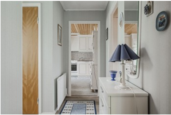
Blick in den Flur