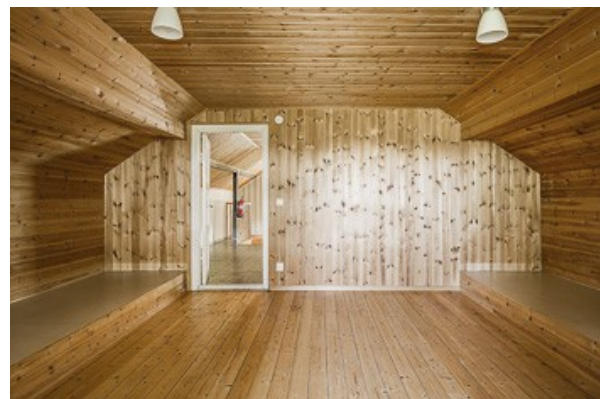
Schlafzimmer im DG