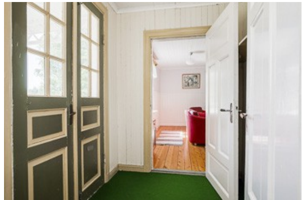
Blick in den Flur