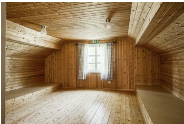
Schlafzimmer im DG