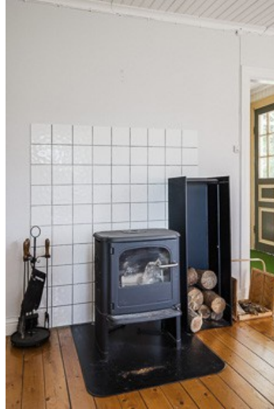
Kaminofen im Wohnzimmer