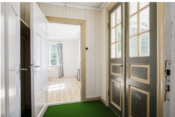
Blick in den Flur