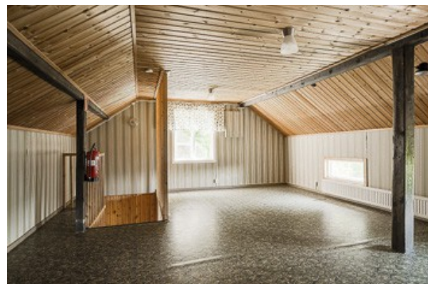
möblierbarer Flur im DG