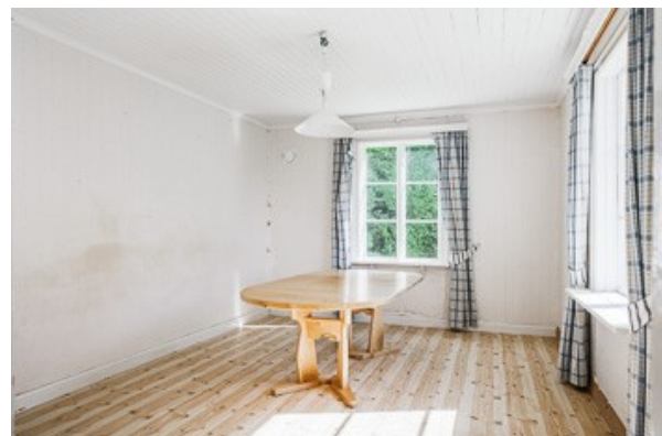
Esszimmer im EG (alt. Schlafzimmer)