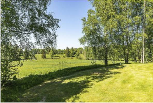
Blick über das Grundstück