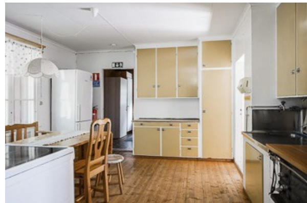
Blick in die Küche