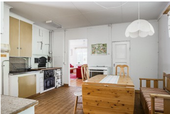
Blick in die Küche