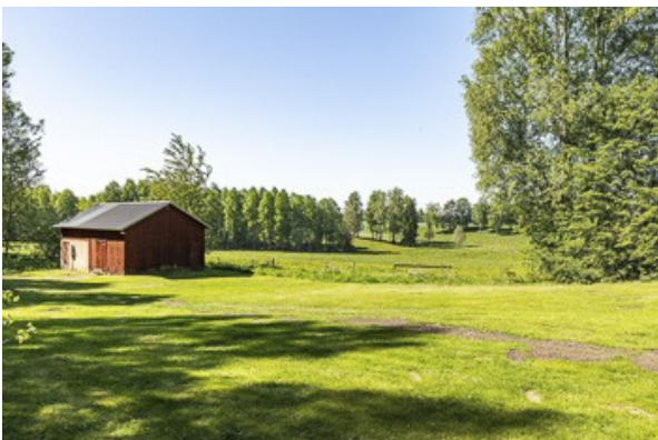
Blick über das Grundstück