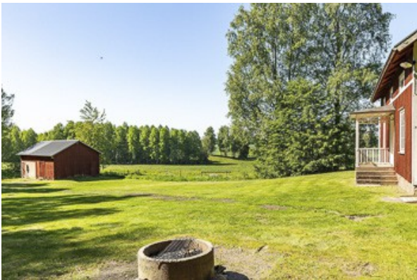
Blick über das Grundstück