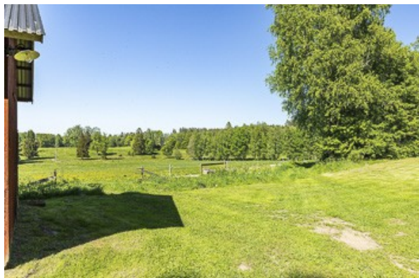
Blick über das Grundstück