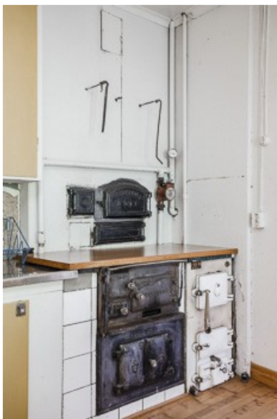
Holzherd in der Küche