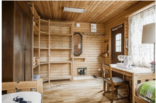
Blick in den Gästeraum am Carport