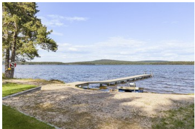
Strand am Vikensee