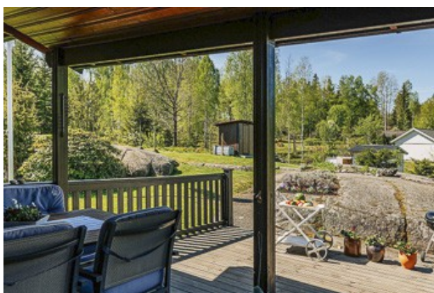
auf der überdachten Veranda