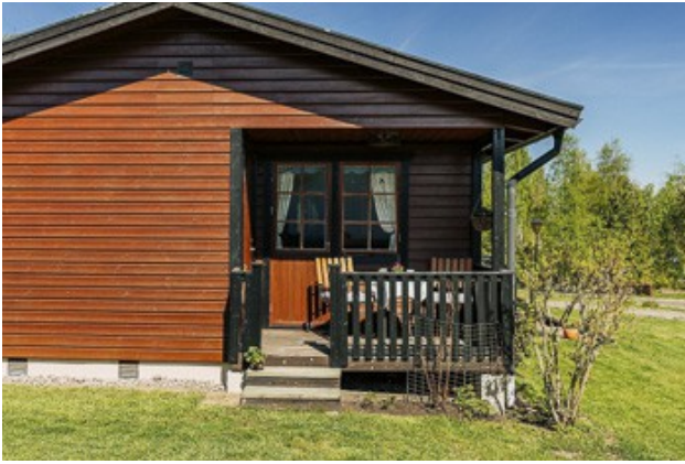
kleine Veranda an der Hausseite