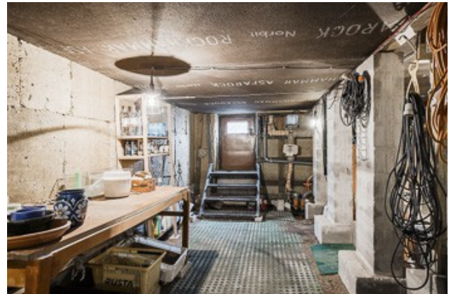
Blick in den Keller