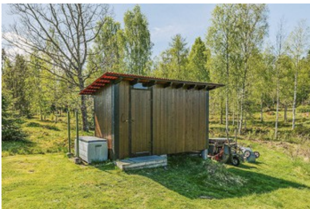
Schuppen für Gartengeräte