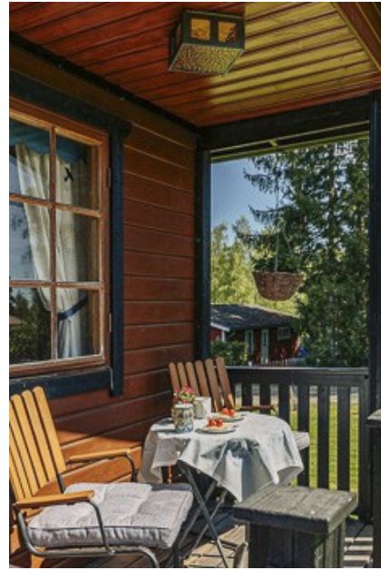
kleine Veranda an der Hausseite