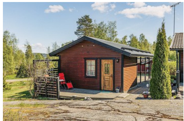
Gästeraum am Carport