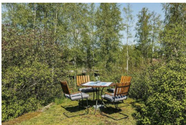
Sitzecke im Garten