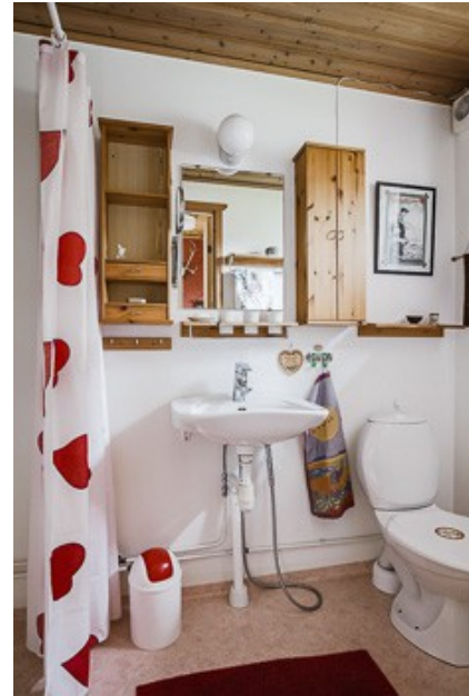
Blick in das Badezimmer