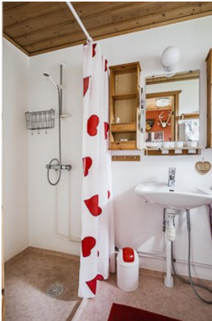
Blick in das Badezimmer