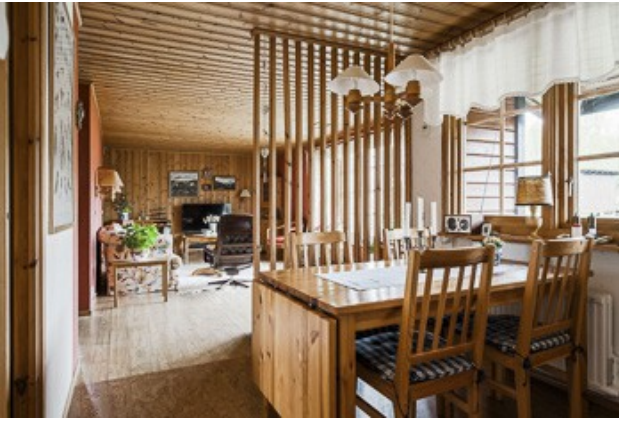
Essecke bei der Küche