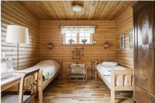
Blick in den Gästeraum am Carport