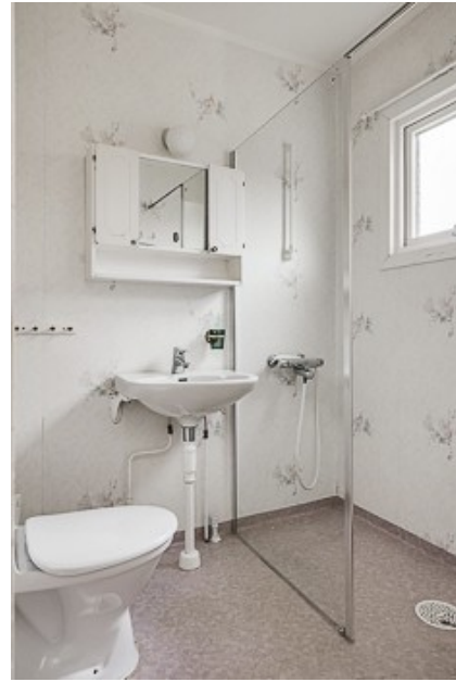
Blick in das Badezimmer