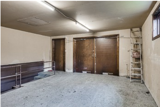
Blick in die Garage