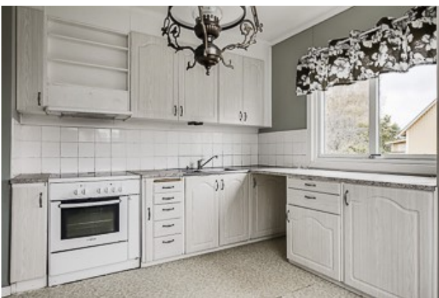
Blick in die Küche