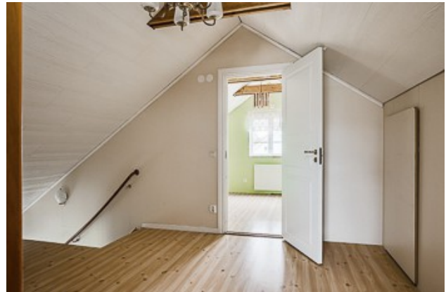
Flur im DG