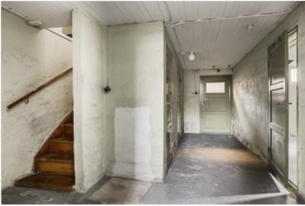
Blick in den Keller