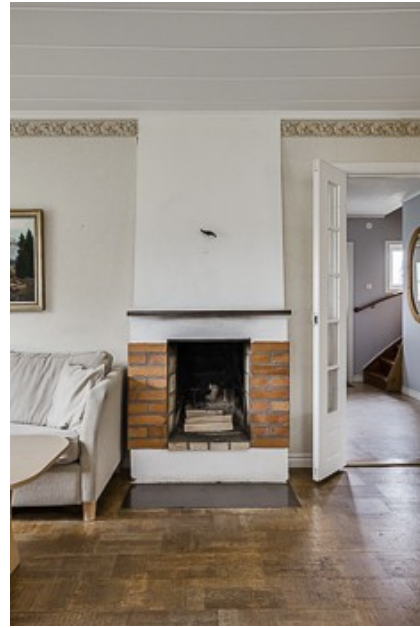
offener Kamin im Wohnzimmer