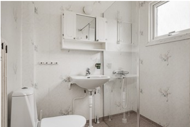
Blick in das Badezimmer