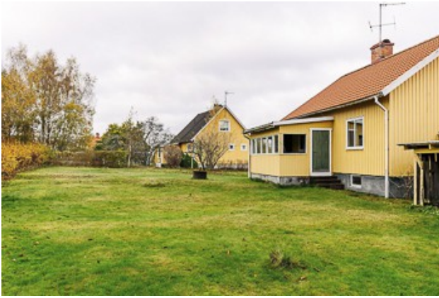
Blick über das Grundstück