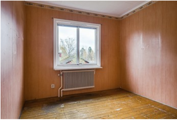
1. Schlafzimmer im EG