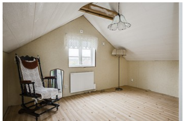
3. Schlafzimmer im DG