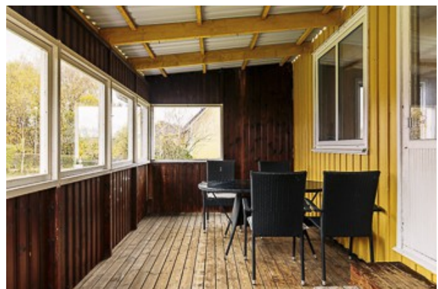
in der verglasten Veranda