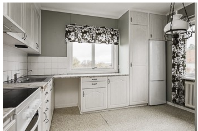
Blick in die Küche