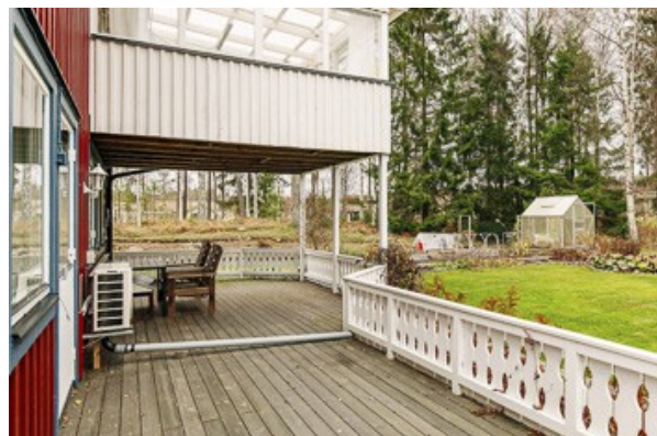
auf der Veranda