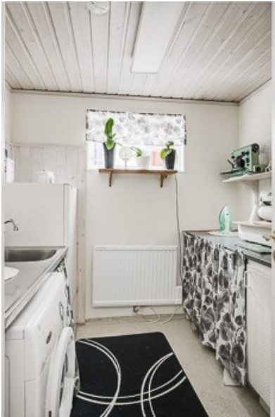
Waschküche im Souterrain