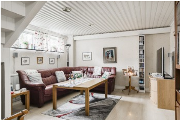
Wohnraum im Souterrain