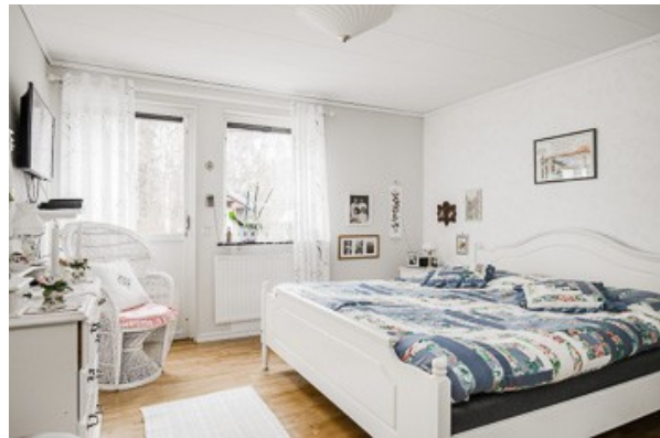
3. Schlafzimmer im Souterrain