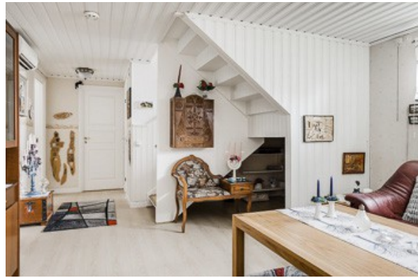
Wohnraum im Souterrain