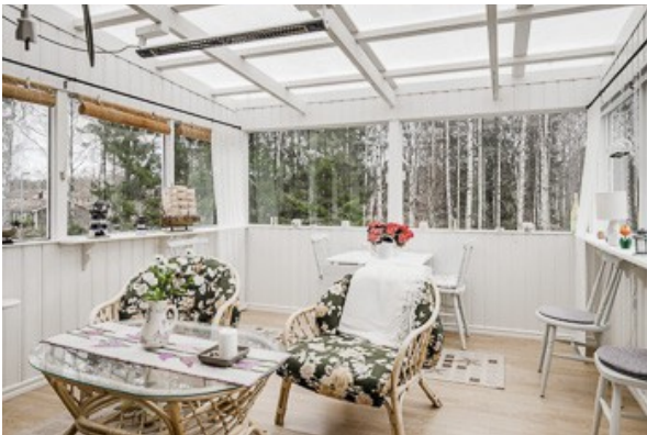
in der verglasten Veranda