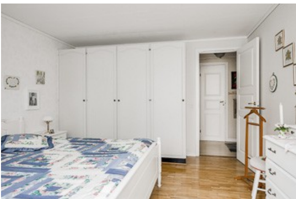
3. Schlafzimmer im Souterrain