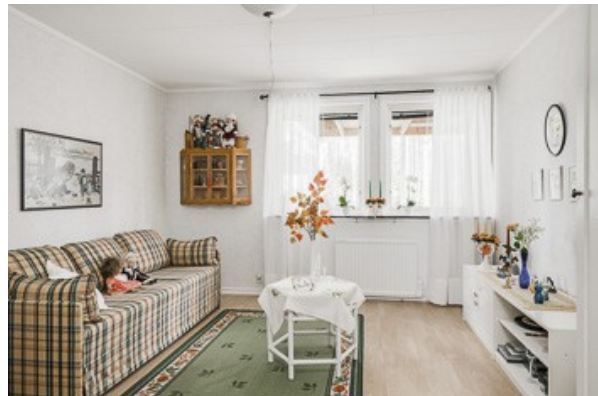
2. Schlafzimmer im Souterrain