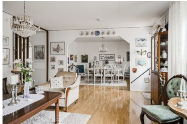
Blick in das Wohnzimmer