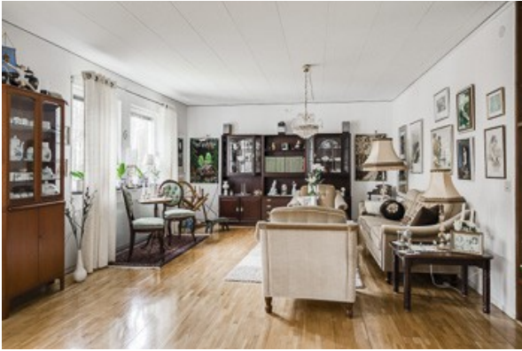
Blick in das Wohnzimmer