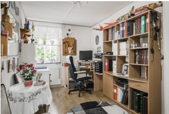
Büro im Souterrain