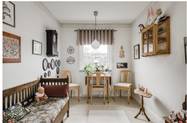
1. Schlafzimmer im EG