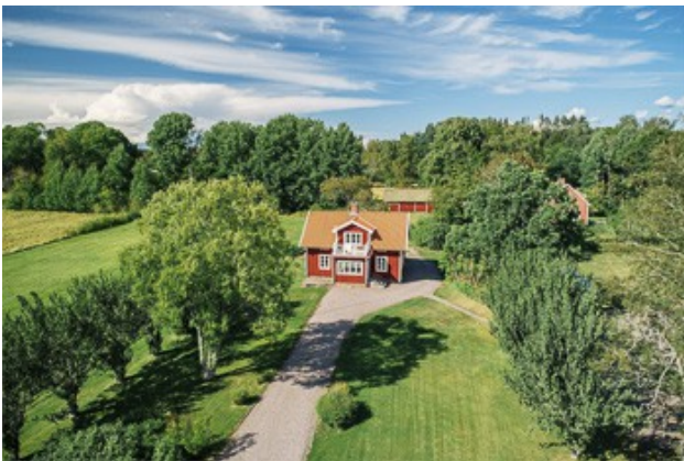
Blick auf das Haus

Besonderheiten: • Glasfaseranschluss für Internet und TV wird zur Zeit im Ort verlegt und ein Anschluss ist möglich