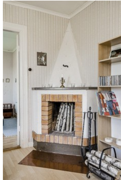
offener Kamin im Fernsehzimmer