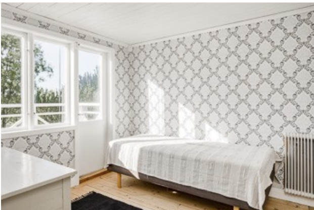
2. Schlafzimmer im DG mit Ausgang auf den Balkon