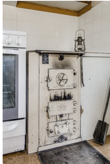
Küchenofen für die Zentralheizung