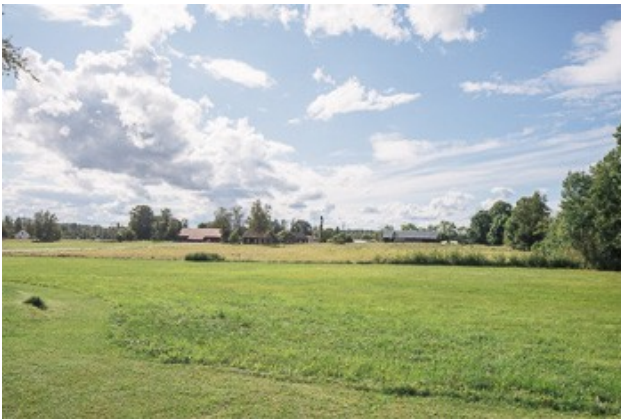
Blick über die eigene Wiese