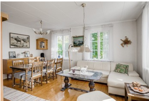
Blick in das Wohnzimmer