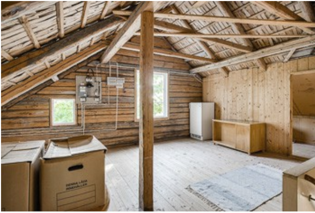
Ausbaureserve im DG