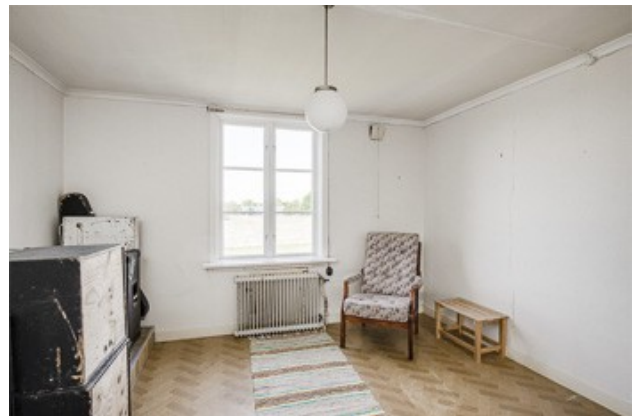
3. Schlafzimmer im DG