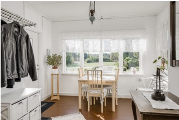
Blick in den Flur