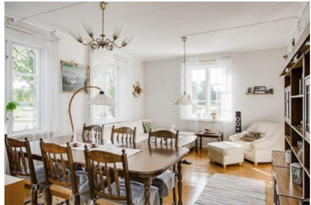
Blick in das Wohnzimmer