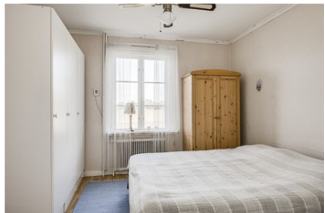
1. Schlafzimmer im EG