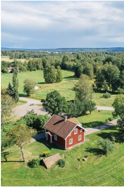
Blick auf das Haus