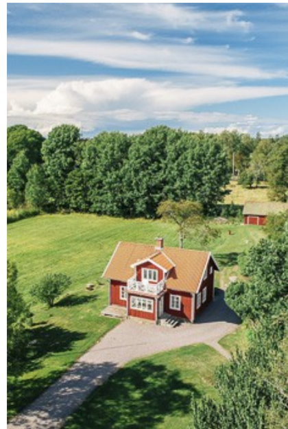
Blick auf das Haus