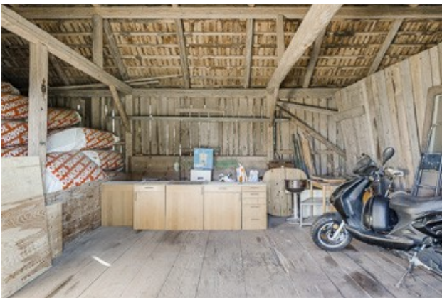
Blick in die Scheune