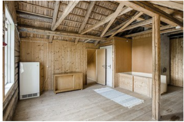
Ausbaureserve im DG