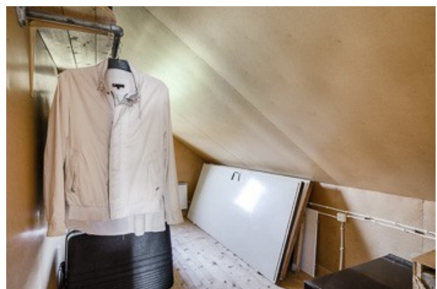
Lagerplatz in den Abseiten