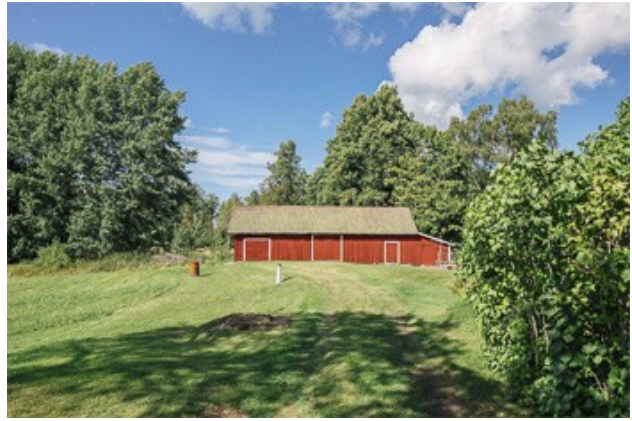
Blick zur Scheune