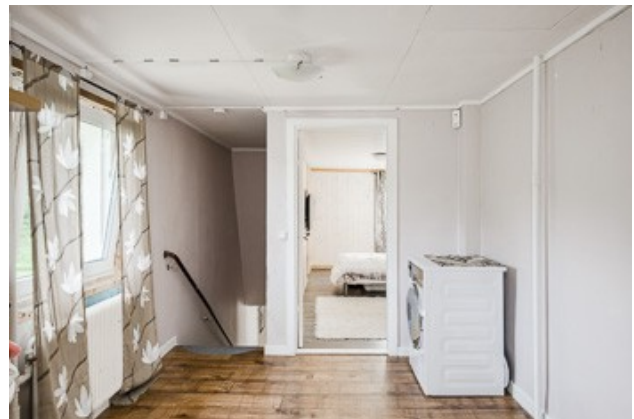
Flur im DG