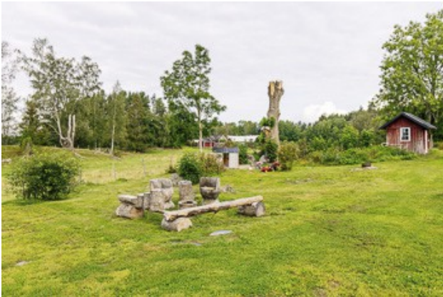
Blick über das Grundstück