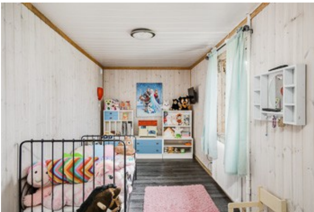
4. Schlafzimmer im DG