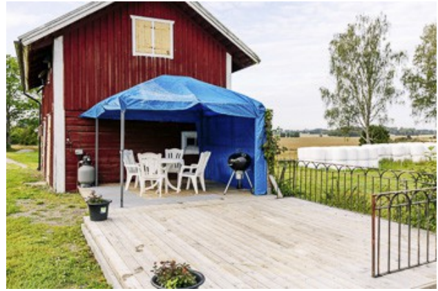
Veranda am Magazin