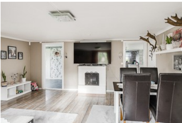
Blick in das Wohnzimmer