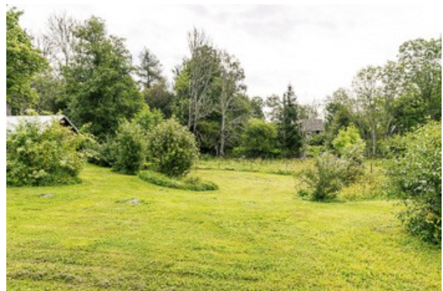
Blick über das Grundstück