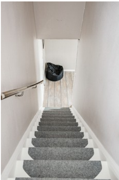
Treppe in das DG