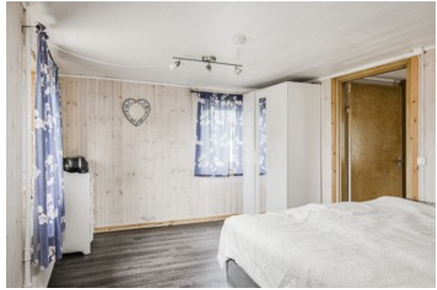
3. Schlafzimmer im DG