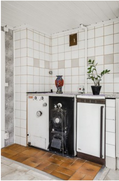
Küchenofen für die Zentralheizung