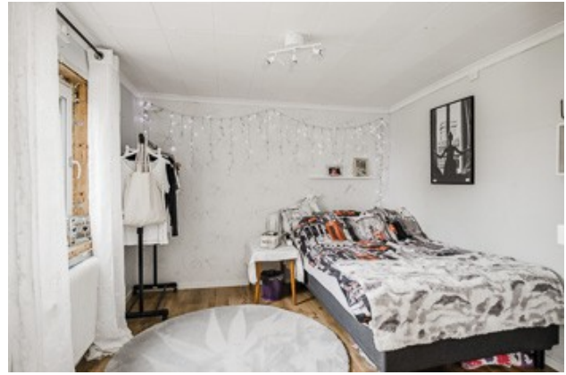
1. Schlafzimmer im EG