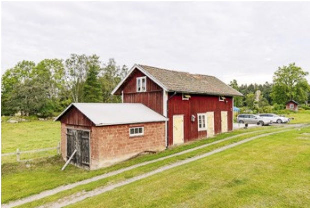
Magazin mit angebauter Garage