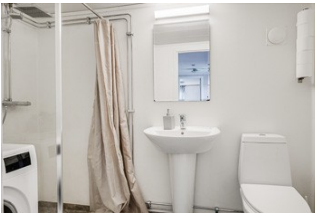
Badezimmer im DG