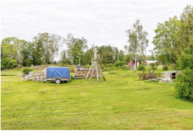
Blick über das Grundstück