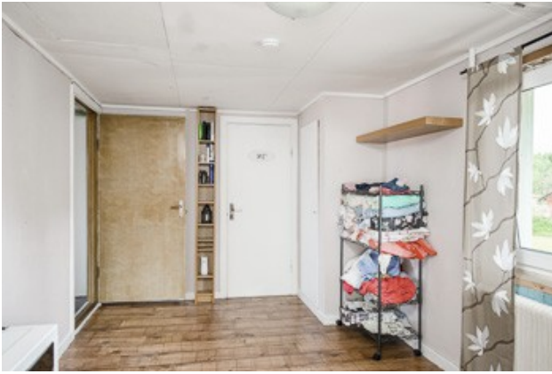
Flur im DG