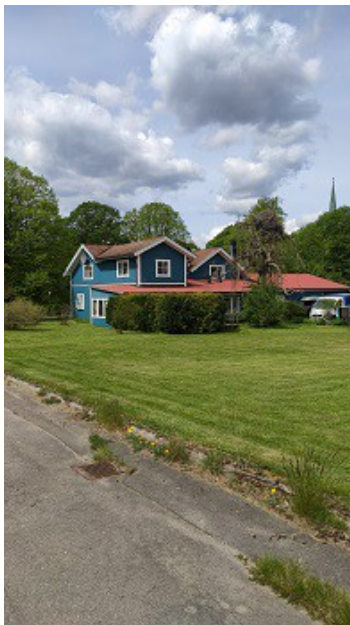
Blick zum Haus