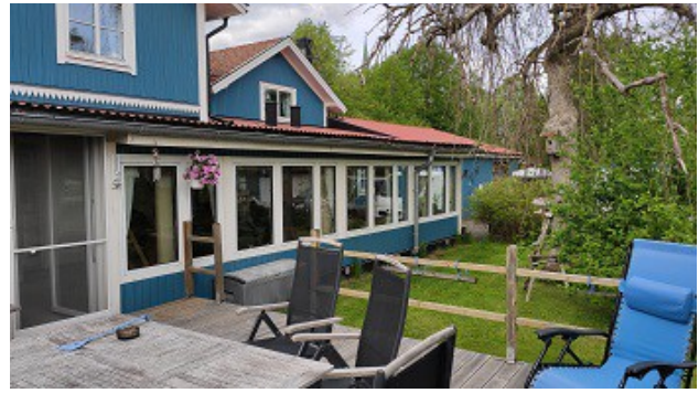
auf der Veranda mit Blick zur verglasten Veranda