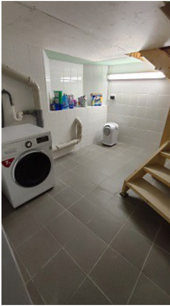
Waschküche im Keller