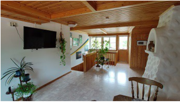
Wohnraum im DG