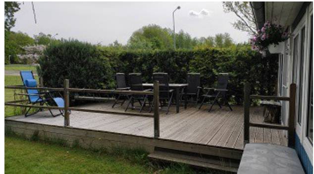
Blick auf die Veranda