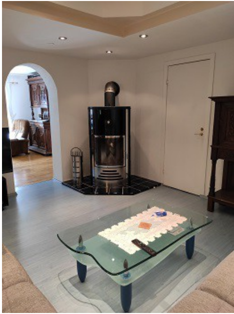
Kamin im Wohnzimmer