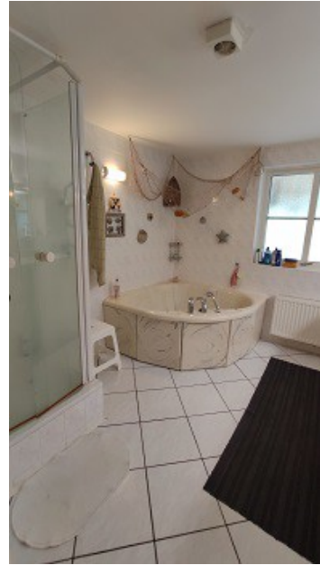
Blick in das Badezimmer