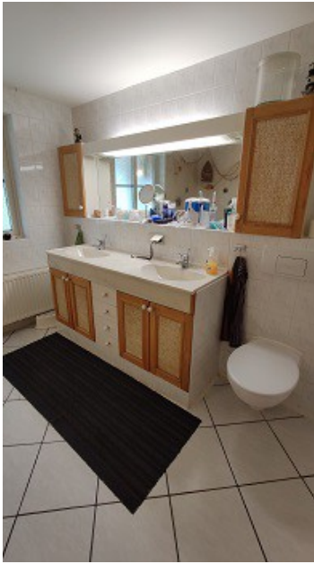
Blick in das Badezimmer