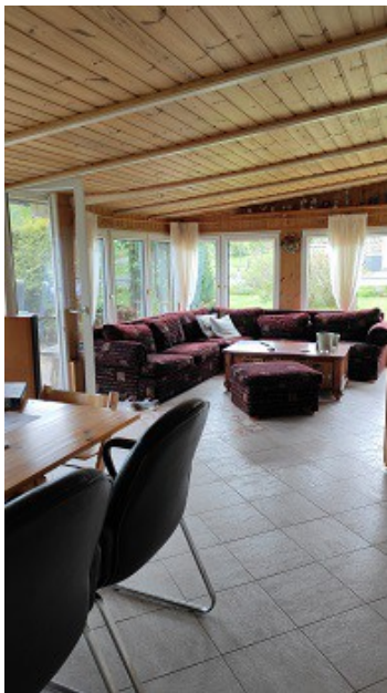
in der verglasten Veranda