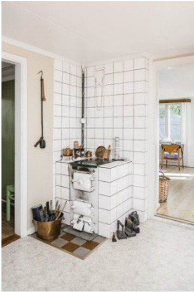
Küchenofen für die Zentralheizung