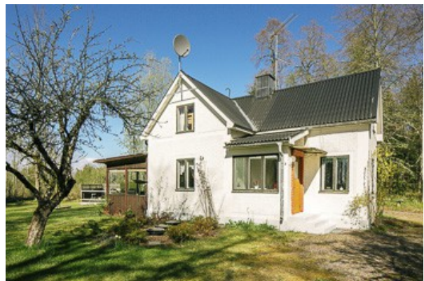
Blick auf das Haus