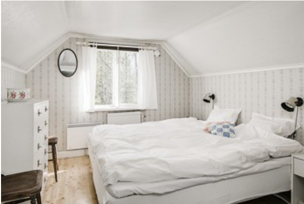
1. Schlafzimmer im DG