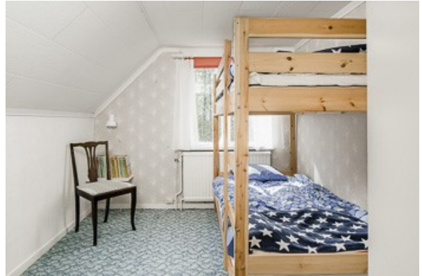
2. Schlafzimmer im DG