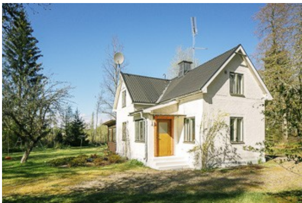
Blick auf das Haus