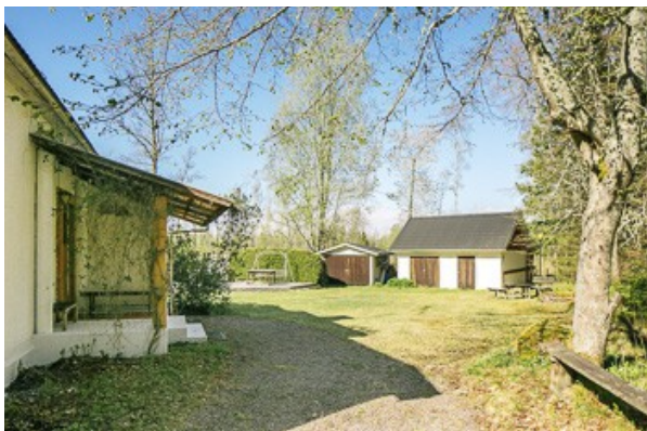
Blick über das Grundstück