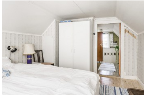
1. Schlafzimmer im DG