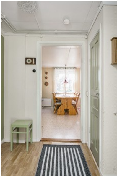
Blick in den Flur