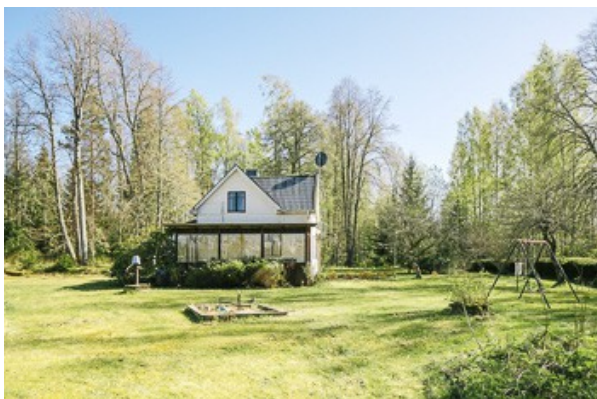
Blick zum Haus