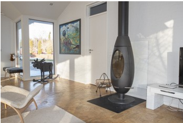
Blick in das Wohnzimmer mit Kamin