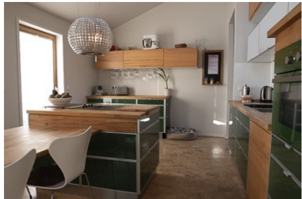
in der Küche