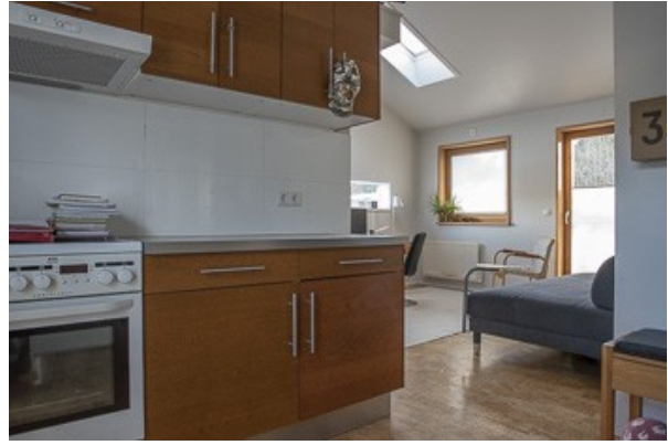
Wohnraum von der Einliegerwohnung