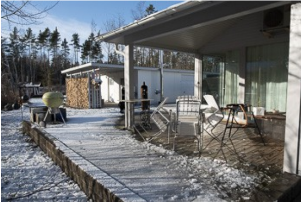
Blick auf die Veranda