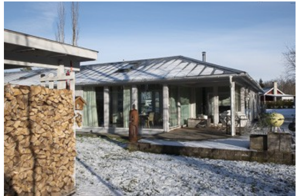
Blick auf die Veranda