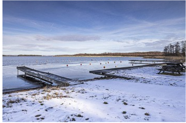
Badeplatz und Bootsanleger am Bottensee