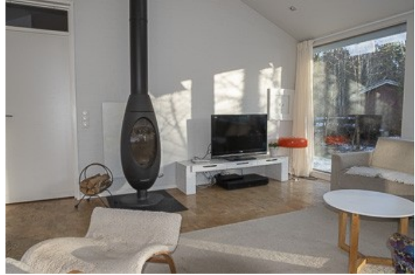
Blick in das Wohnzimmer mit Kamin