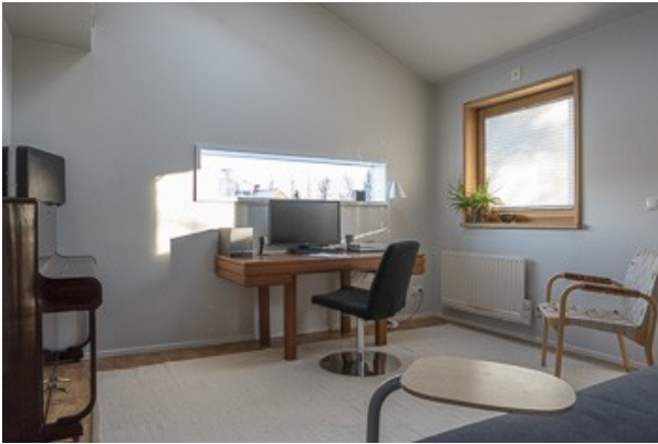
Wohnraum von der Einliegerwohnung