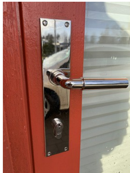
Detailbild der Eingangstür