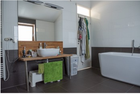
Blick in das Badezimmer