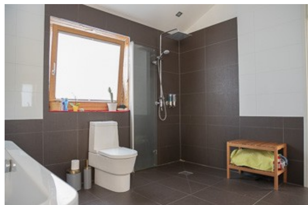
Blick in das Badezimmer