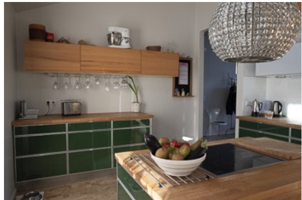
in der Küche