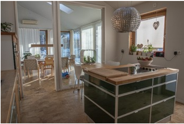
Blick von der Küche zum Wohnzimmer