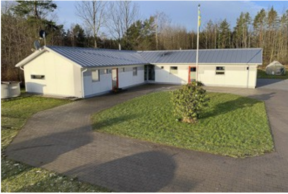
Blick auf das Haus