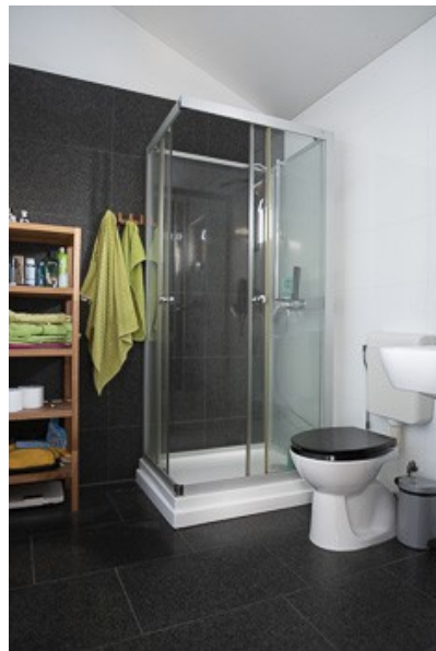
Badezimmer der Einliegerwohnung