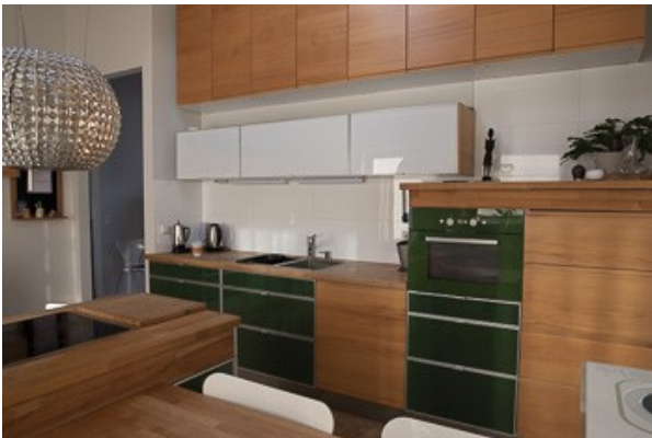
in der Küche