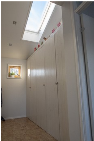
Blick in den Flur