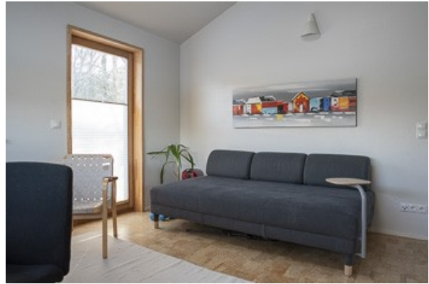
Wohnraum von der Einliegerwohnung