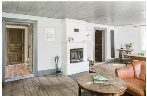
Blick in das Wohnzimmer