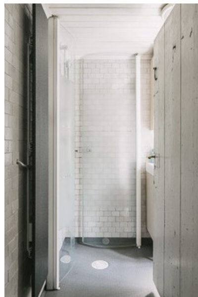
Blick in das Badezimmer