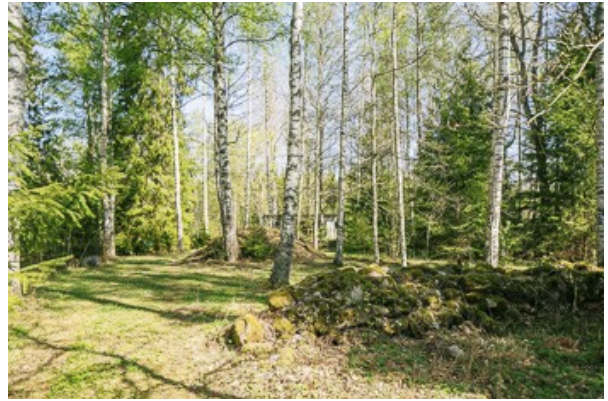
Blick über das Grundstück