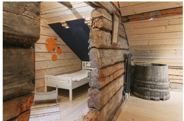
Schlafnische im DG