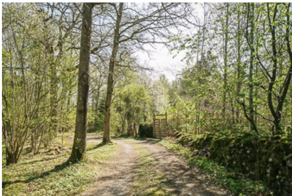
Blick über das Grundstück