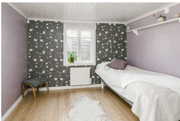
Schlafzimmer im EG