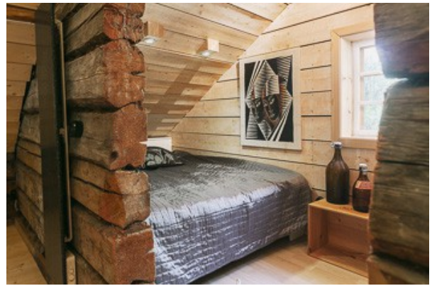
Schlafnische im DG