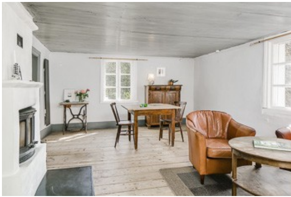
Blick in das Wohnzimmer