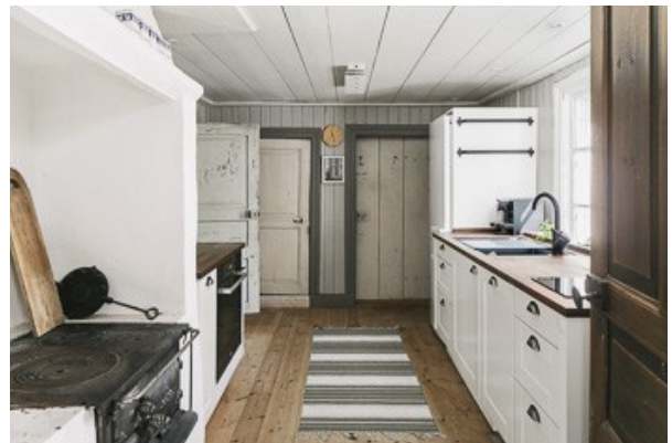
in der Küche