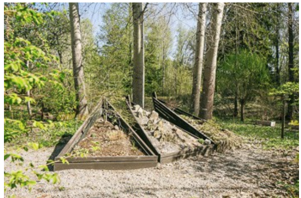
Blick über das Grundstück