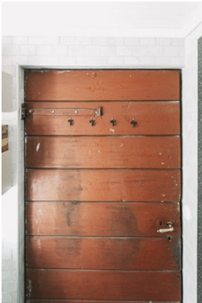
Eingangstür zum Badezimmer