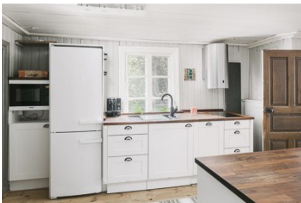
in der Küche