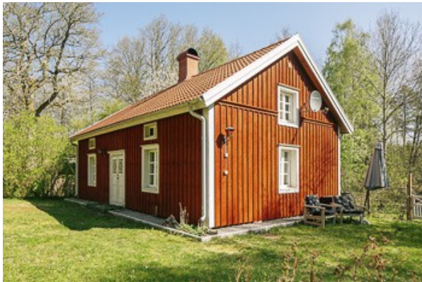
Blick auf das Haus

Besonderheiten: • Glasfaseranschluss für Internet und Fernsehen • neue Fassade inkl. zusätzlicher Isolierung (2011/2012)