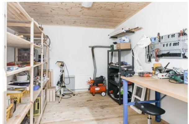
Werkstatt im Nebengebäude