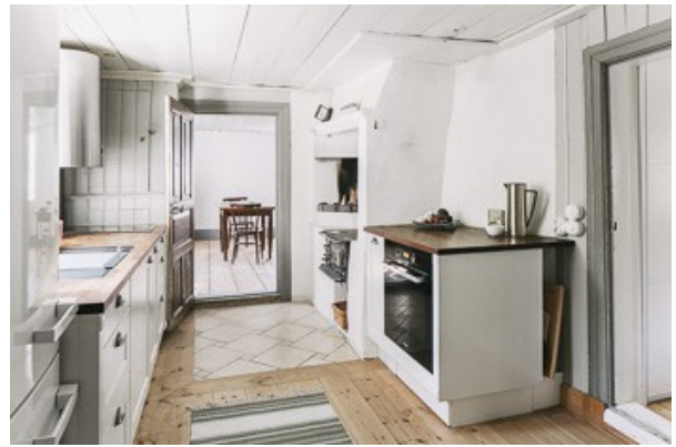
in der Küche