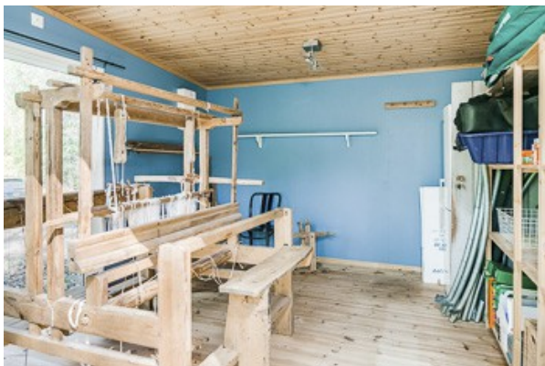
Gästezimmer im Nebengebäude (heute Hobbyraum)