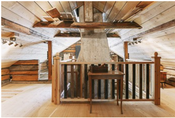
Wohnraum im DG