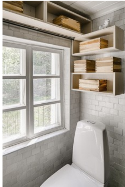
Blick in das Badezimmer