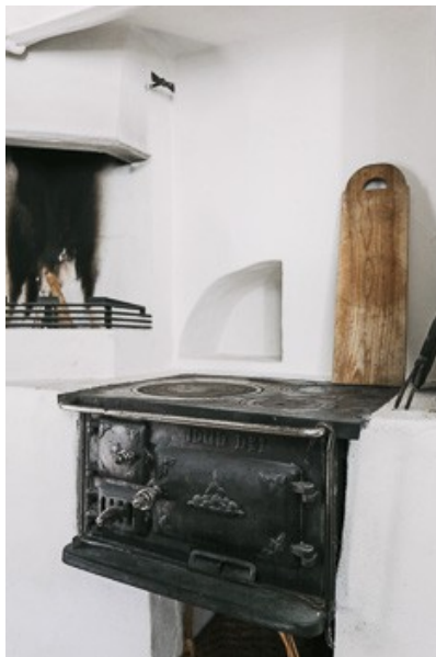
Holzherd mit zusätzl. offener Feuerstelle