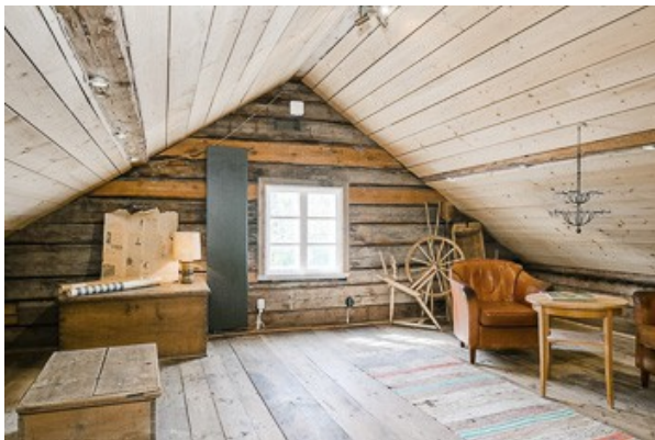
Wohnraum im DG