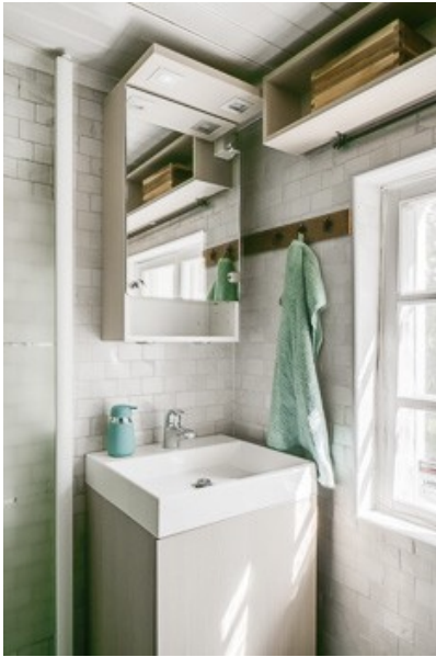
Blick in das Badezimmer