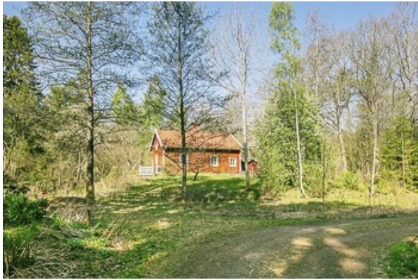
Blick über das Grundstück zum Haus