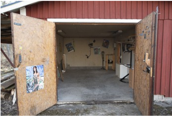
Blick in die Garage