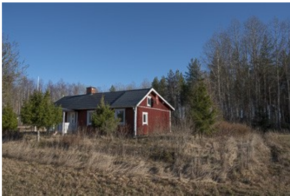
Blick zum Haus