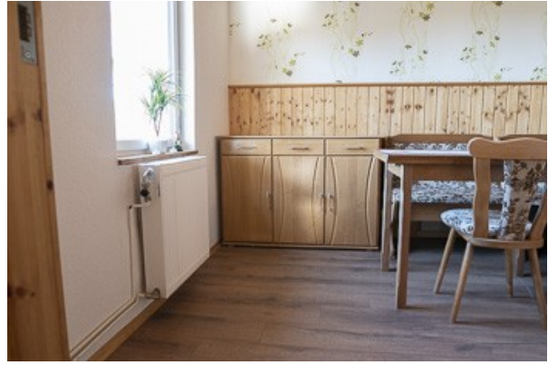
Esszimmer bei der Küche