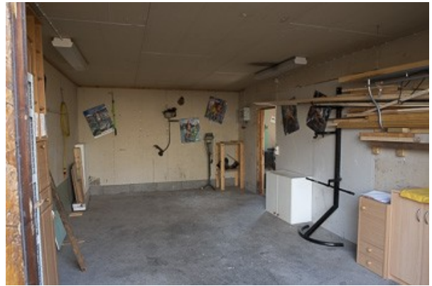
Blick in die Garage