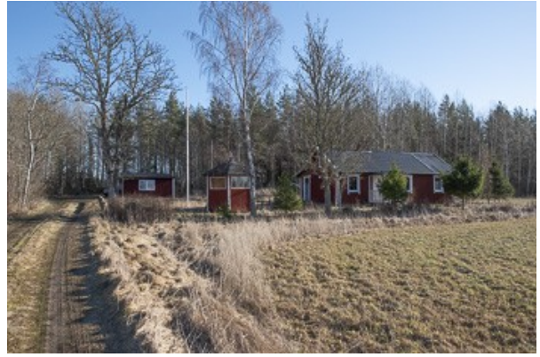
Weg zum Haus