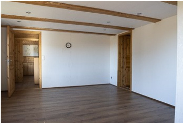
Blick in das Wohnzimmer