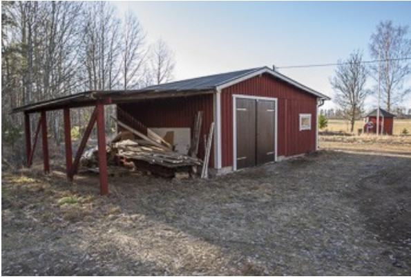
Nebengebäude mit Garage und Werkstatt