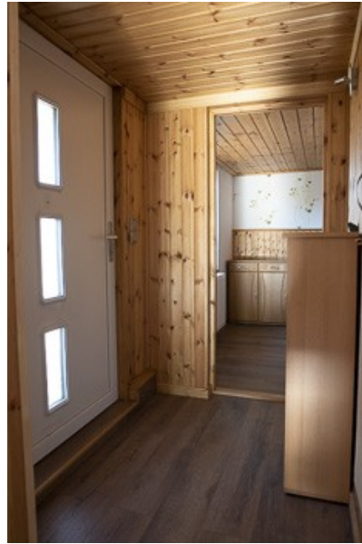
Blick in den Flur