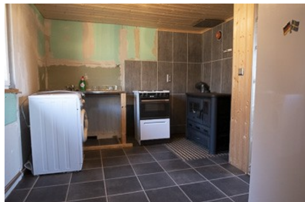
in der Küche