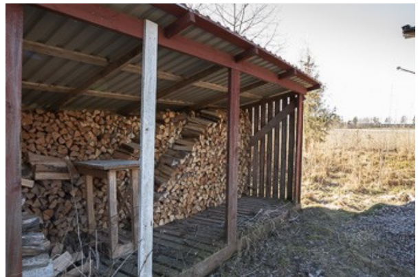
Unterstand für das Brennholz