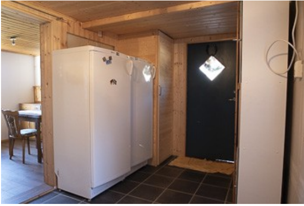
in der Küche