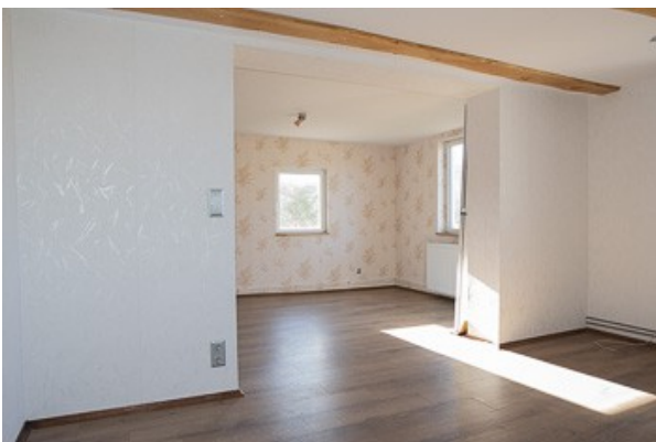
Blick in das Wohnzimmer