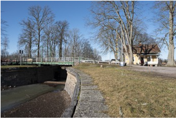
am Götakanal in Hajstorp