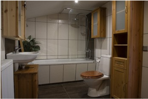
Blick in das Badezimmer