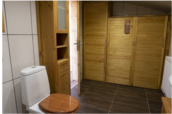
Blick in das Badezimmer