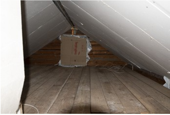
Blick in den Dachboden