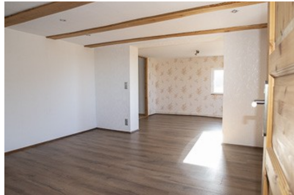
Blick in das Wohnzimmer