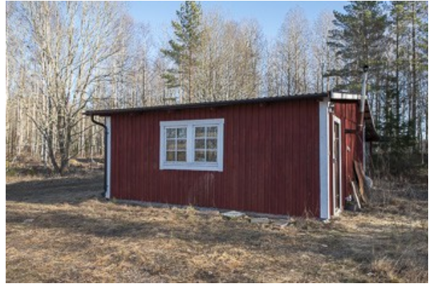
Nebengebäude mit Garage und Werkstatt